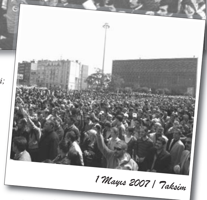
1 Mayıs 2007 | Taksim

Krizle karşı 1 Mayıs'ta "sermayeye bir tokat" atılması gerektiğini iddia eden ancak Taksim 1 Mayıs'ını "alan tartışmaları"na indirgeyen ve altını boşaltmaya çalışan bir takım liberal reformist anlayışlar, ne krizin ortaya çıkardığı toplumsal hoşnutsuzluğun sistemi hedef alan bir mevziye